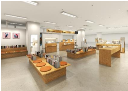
待合スペースには書籍も用意