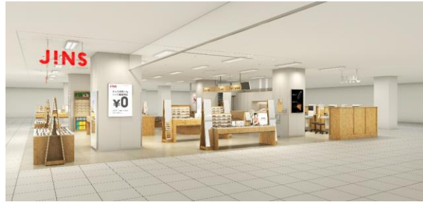
シンプルでありながら抑揚を感じる空間