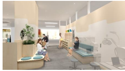
山々を抽象的に表現した、玉ねぎ色のグラフィックが彩る待合スペース