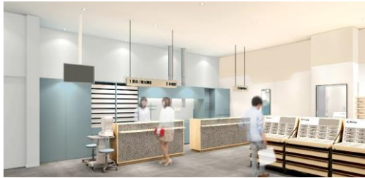
流水をイメージした青色がアクセント